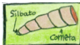
Imagen y dibujos de una mueya . Lucía Bada, Tielve, Cabrales, Asturias.